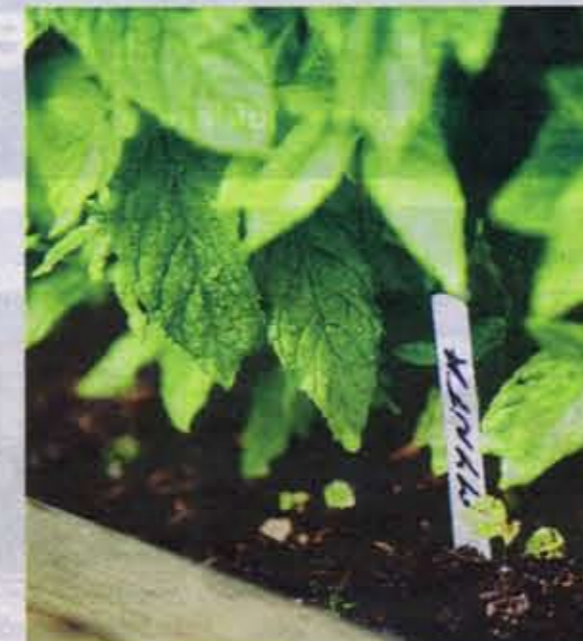
Köksträdgården i nedre delen av tomten har paret själv planerat och planterat.