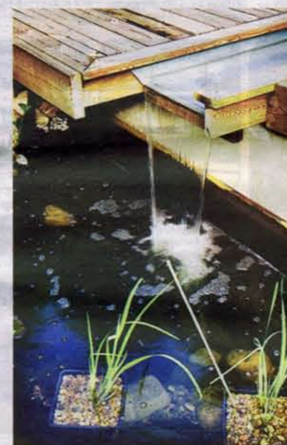
Däcket möter dammen. Medvetet sticker träet ut över kanten för att inte ge ett alltför tungt, massivt intryck.